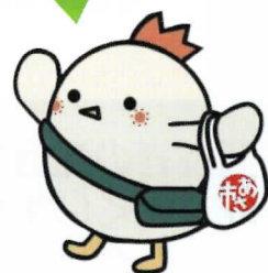
あさいちくんです