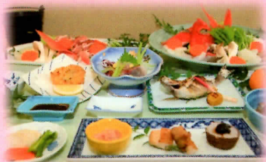
～ 御夕食一例 ～

伊豆三大美浜の一つ弓ヶ浜海岸まで徒歩3分の場所にある弓ヶ浜クラブ。 温泉はナトリウム・カルシウム-塩化物泉の源泉かけ流しで、神経痛、冷え症、疲労回復などの効果があります。季節の食材を使った板長自慢の旬会席は毎回ご好評いただいております。美味しい御夕食をどうぞご堪能くださいませ。