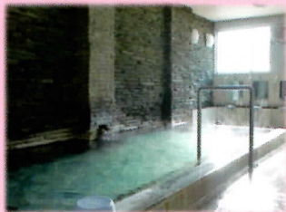
弓ヶ浜クラブ温泉