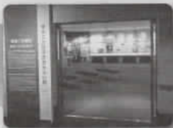
▲杉並清掃工場の歴史と教訓を伝える 「東京ごみ戦争歴史みらい館」