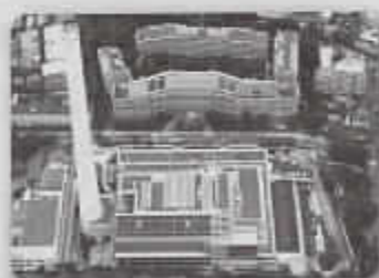
▲上空から見た工場