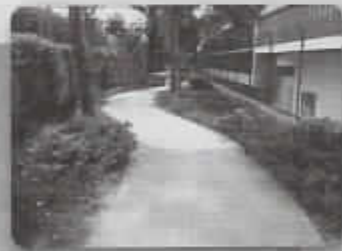
▲四季折々の草花を楽しみながら 散策できる「ウォーキングロード」