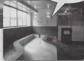
ごみを焼却した際に発生する 熱エネルギーを有効利用した 「高井戸の里あし湯」▶