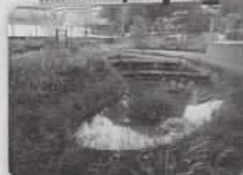
◀自然の生態系を 身近に感じる「ビオトープ」