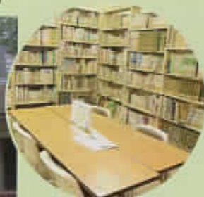
▲植物に関する本の閲覧もできます。