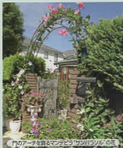
門のアーチを飾るマンデビラ「サンパシール」の花