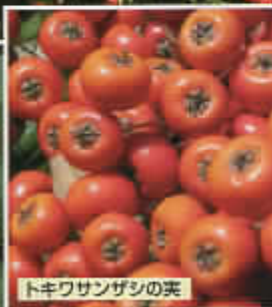
トキワサンザシの実