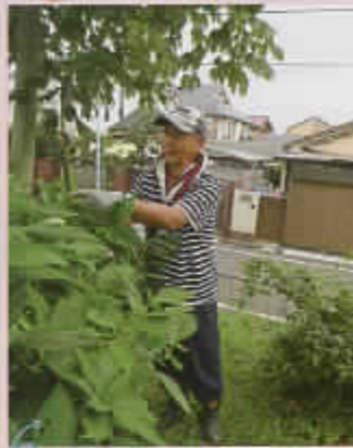
▼三泉淵緑地 草刈り