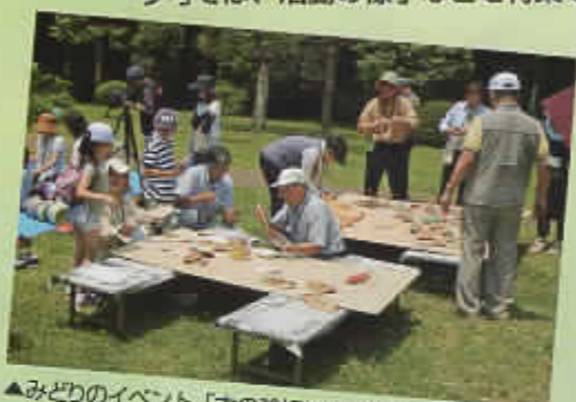
▲みどりのイベント「木の輪切りに絵を描こう」 (柏の宮公園)

みどりのボランティア杉並は、地域緑化に関するボランティア活動を始めようとする方を対象として、区が設立したボランティアグループです。 今号では、活動の様子などを特集で紹介しします。