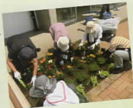
花壇管理 (桃井原っぱ公園) ▶