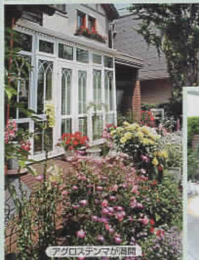
アグロステンマが満開