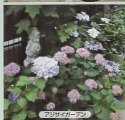
アジサイガーデン