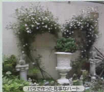
バラで作った見事なハート