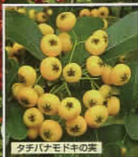
タチバナモドキの実