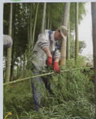
▼下井草いこいの森 土留めづくり