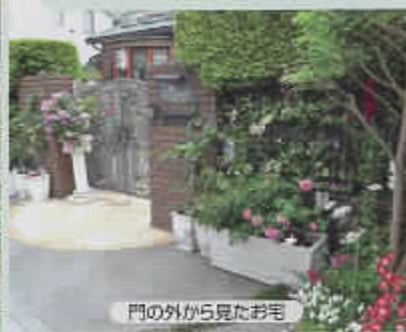
門の外から見たお宅