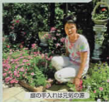
庭の手入れは元気の源