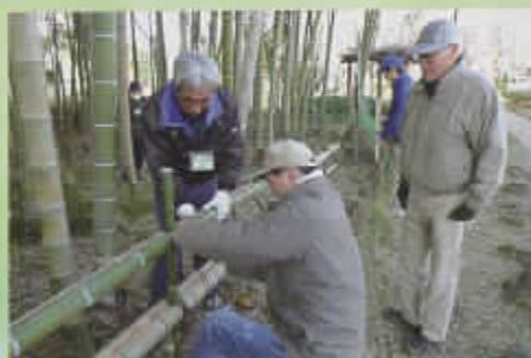
◀竹垣づくり (宮前公園)