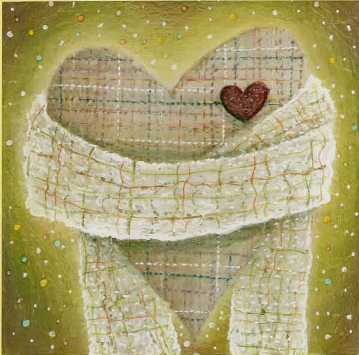
「クリスマスのハートの型」 木村真実 Artbility ※この作品は障害者アーティストによる作品です