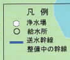
送水管ネットワーク（イメージ図）

事故や災害により、個別の施設が停止しても給水できるよう、 代替施設の整備 や 管路の二重化 、 ネットワーク化 等を推進