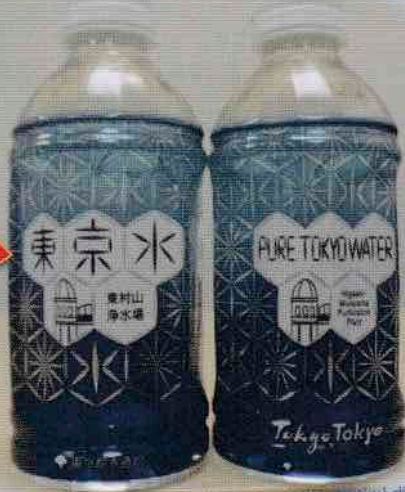
ペットボトル「東京水」は製造過程で塩素を除去しています。

水道局の広報イベントで東京水を配布しています。是非手に取り、味わってみてください!