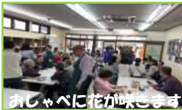
おしゃべりに花が咲きます