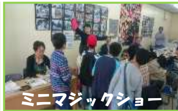
ミニマジックショー