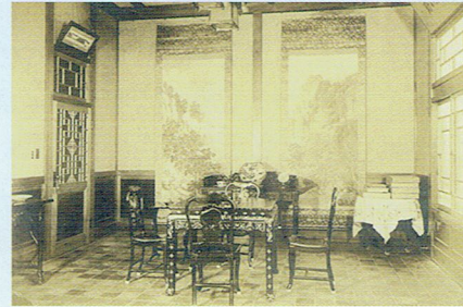
◀昭和12年以前の荻外荘・応接間