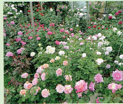
コンテスト用のバラ約60鉢