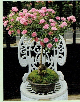
ご主人お気に入りの盆栽「ピンクレディ」