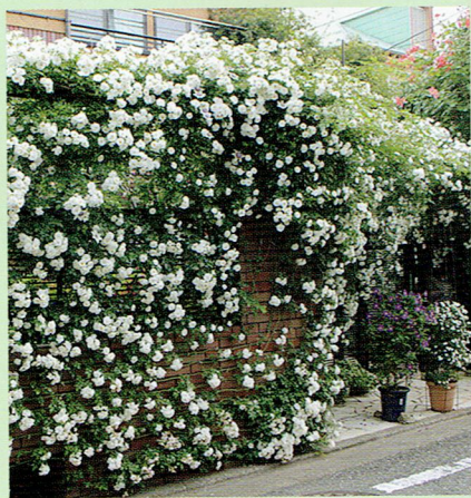
ツルバラ「サンダースホワイト」(5月) 一年がかりで形を作っていきます。