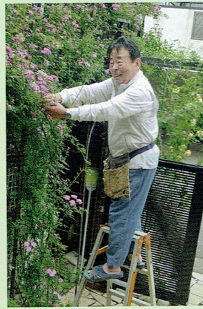
日々のお手入れに余念がないご主人。奥様の名前をつけたバラもあります。