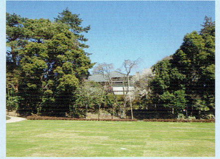
▲現在の荻外荘の様子

現在、豊島区に移築されていた荻外荘の一部を解体し、荻窪の地に保管しています。今後建物の復原など本格的に整備をすすめていきます。歴史的・文化的資源の保存にご賛同いただき、皆様からのご寄附をお待ちしています。