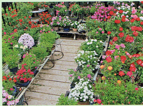
4m×3mの区画に約90鉢ある「ミニバラ盆栽」