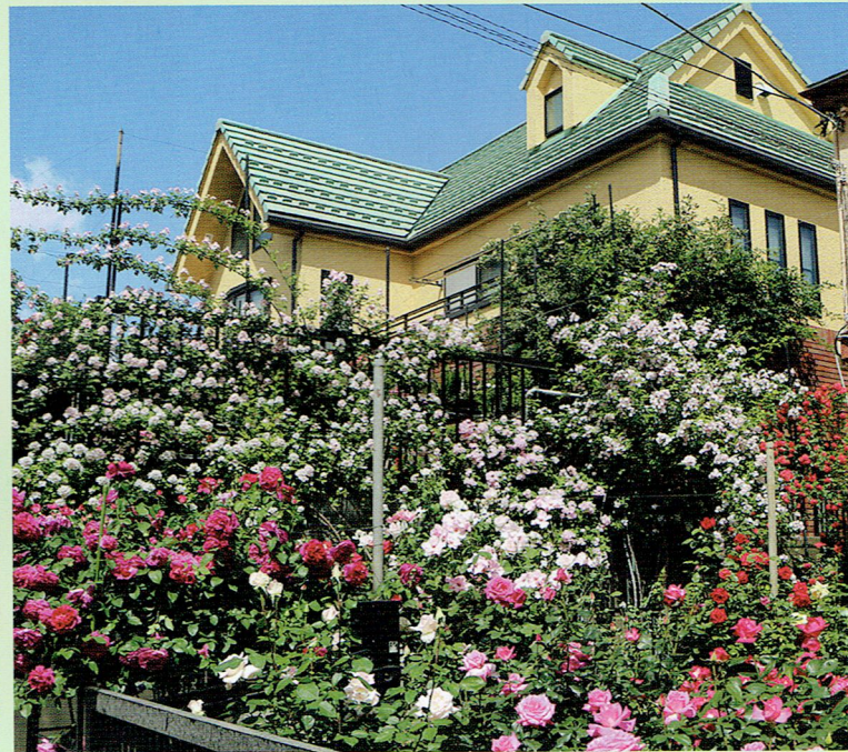
5月中旬の満開時にはバラが溢れ、華やいだ高級感の漂う特別な空間を作り出します。