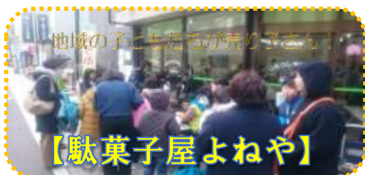
地域の子もたらが売り子さん♪