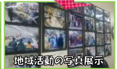
地域活動の写真展示

運営：西荻南きずなサロン（西荻南中央会、西荻窪町会、西荻東銀座会、荻窪・宮前民生児童委員、地域協力者）