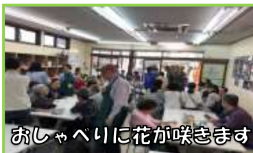
おしゃべりに花が咲きます