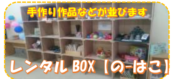
手作り作品などが並びます