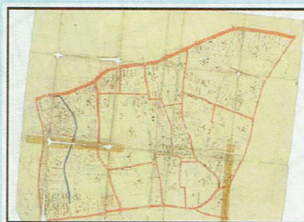
※1 登記所で保管している地図(公図)

地籍調査では、境界の位置を全て地球の緯度経度に結び付けて数値化するため、その位置を容易に復元することができ、災害時にガス・上下水道などのライフラインの復旧を迅速に進めることが可能になります。