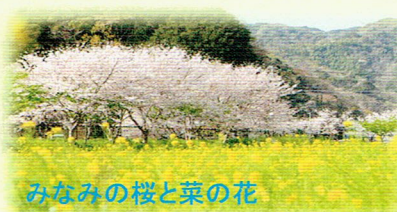
みなみの桜と菜の花