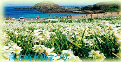
麻木崎水仙まつり