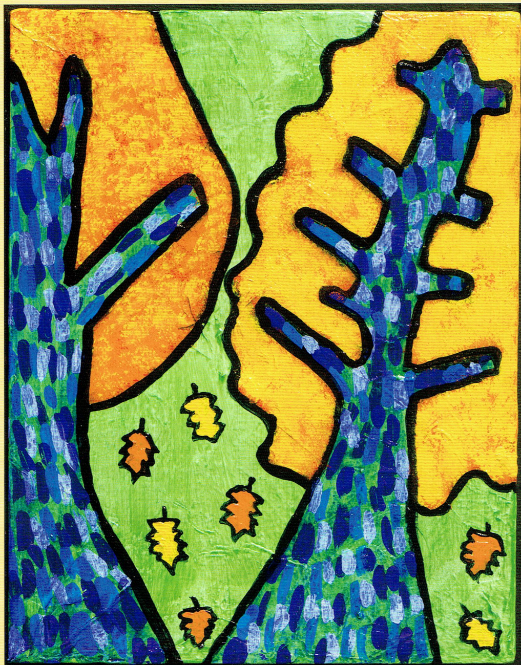
「あきのもり」 カミジヨウ ミカ Artbility ※この作品は障害者アーティストによる作品です