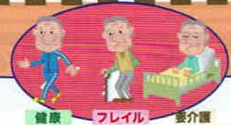
健康 フレイル 要介護

日時 12月15日(火) 13:30~15:00 定員 15名 参加費 無料 講師 西荻窪診療所通所リハビリ 理学療法士 中崎恭江氏 対象 区内在住、在勤の方 持ち物 飲み物 汗ふきタオル