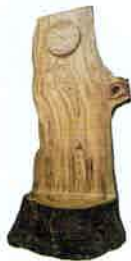
シンボルツリーのクスノキを用いた時計のモニュメント（高さ約2m20cm）