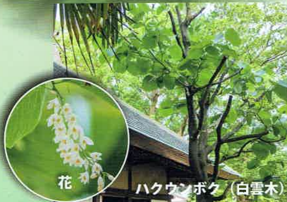
ハクウンボク (白雲木)