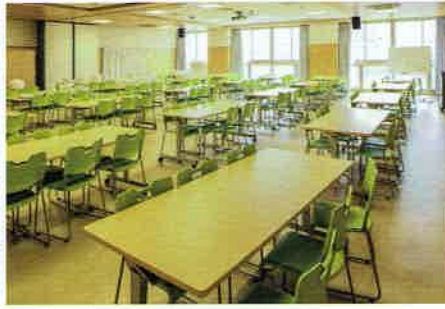
多目的・ランチルーム

また、1階玄関ホールに「交流ホール」という広い空間を設け、集会や部活、児童の学習の場などの様々な活動に広く使用できる工夫をしています。