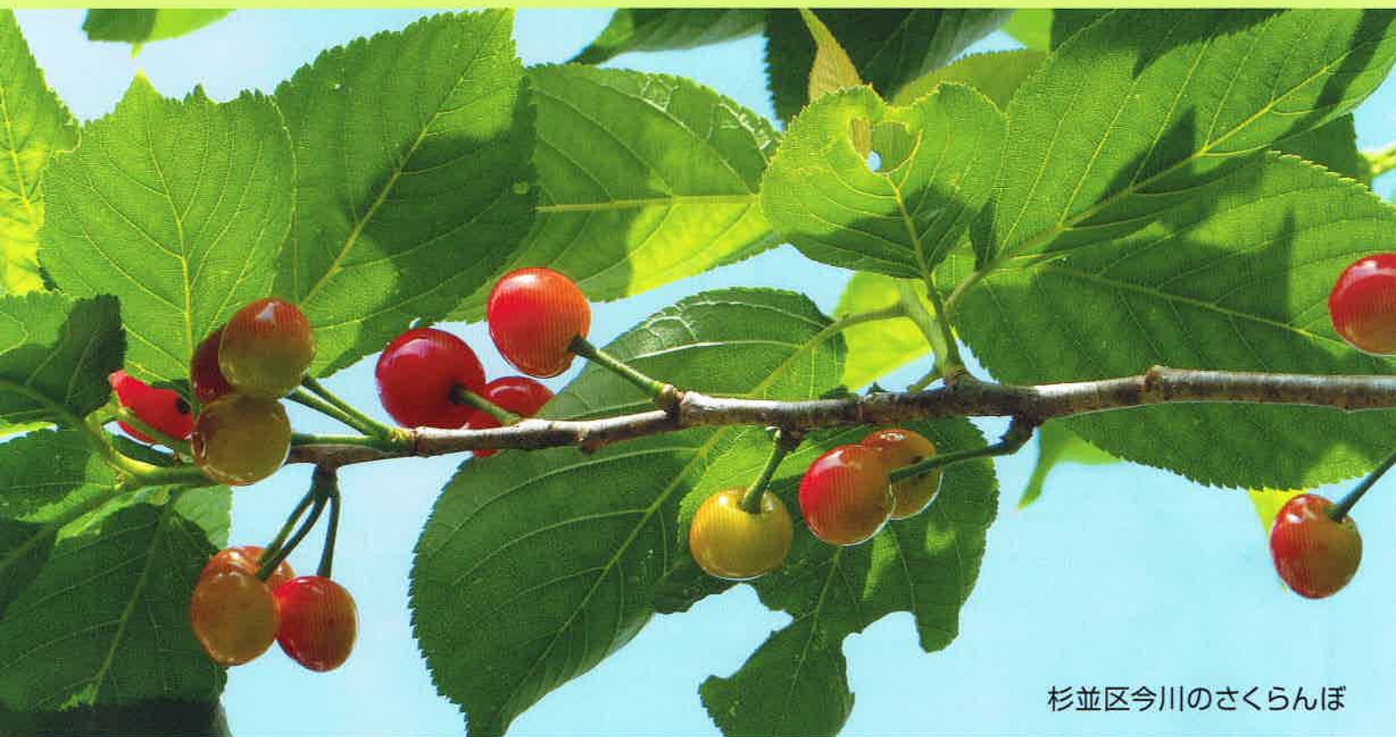
杉並区今川のさくらんぼ