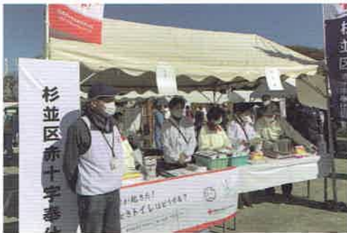
令和3年11月13日(土) 和田堀公園