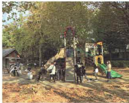
令和3年11月15日(月) 16日(火) 19日(金) 善福寺川緑地公園