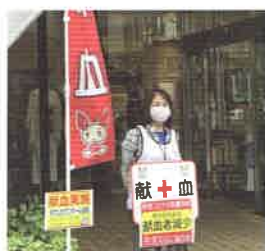
荻窪タウンセブン

荻窪タウンセブンで6月13日に初めての献血が行われました。利便性の良さから、多くの方の参加がありました。