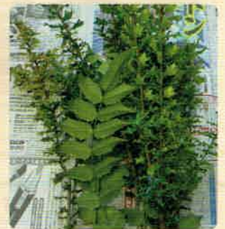
とげのある植物は紙で包んでください。