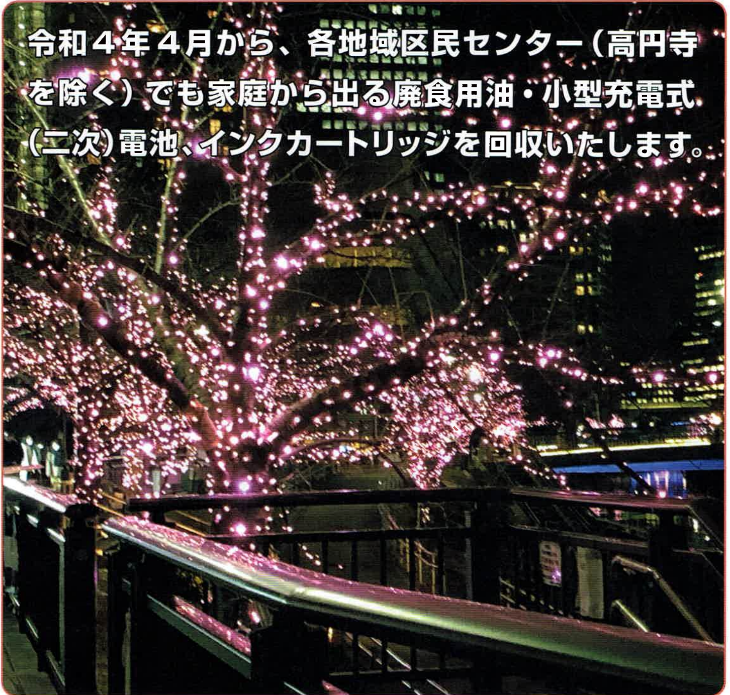
写真：目黒川みんなのイルミネーション2021 (廃食用油をバイオディーゼル燃料にリサイクルして発電に使用)

令和4年4月から、各地域区民センター(高円寺を除く)でも家庭から出る廃食用油・小型充電式(二次)電池、インクカートリッジを回収いたします。