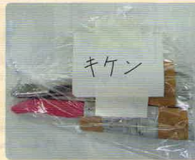
刃物類のごみの出し方