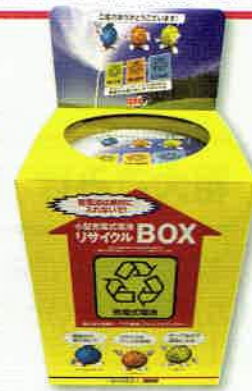
リサイクルボックス

小型充電式(二次)電池には、ニッケル・カドミウム・コバルトなど希少な金属が使われています。そのため、一般社団法人JBRCでは、2001年に施行された「資源の有効な利用の促進に関する法律」に基づき、協力店(電気店やスーパーマーケットなど)での回収を開始しました。区でも2020年2月より協力団体として、「小型充電式電池リサイクルボックス」(右の写真)を設置し、回収をしています。可燃ごみやプラスチック製容器包装に混入すると発火の恐れもあり危険です。適正な排出及び資源の再利用のため、回収拠点への持ち込みをお願いします。