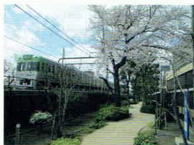
ウォーキングロード

信頼される清掃工場」を目指し、建物屋上・壁面等の緑化を行うとともに、地元から要望のあったウォーキングロードが整備され、高井戸の景観との調和が図られています。