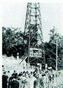
清掃工場建設反対運動