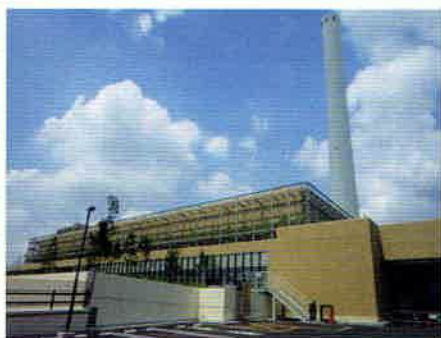
現在の杉並清掃工場 ※5