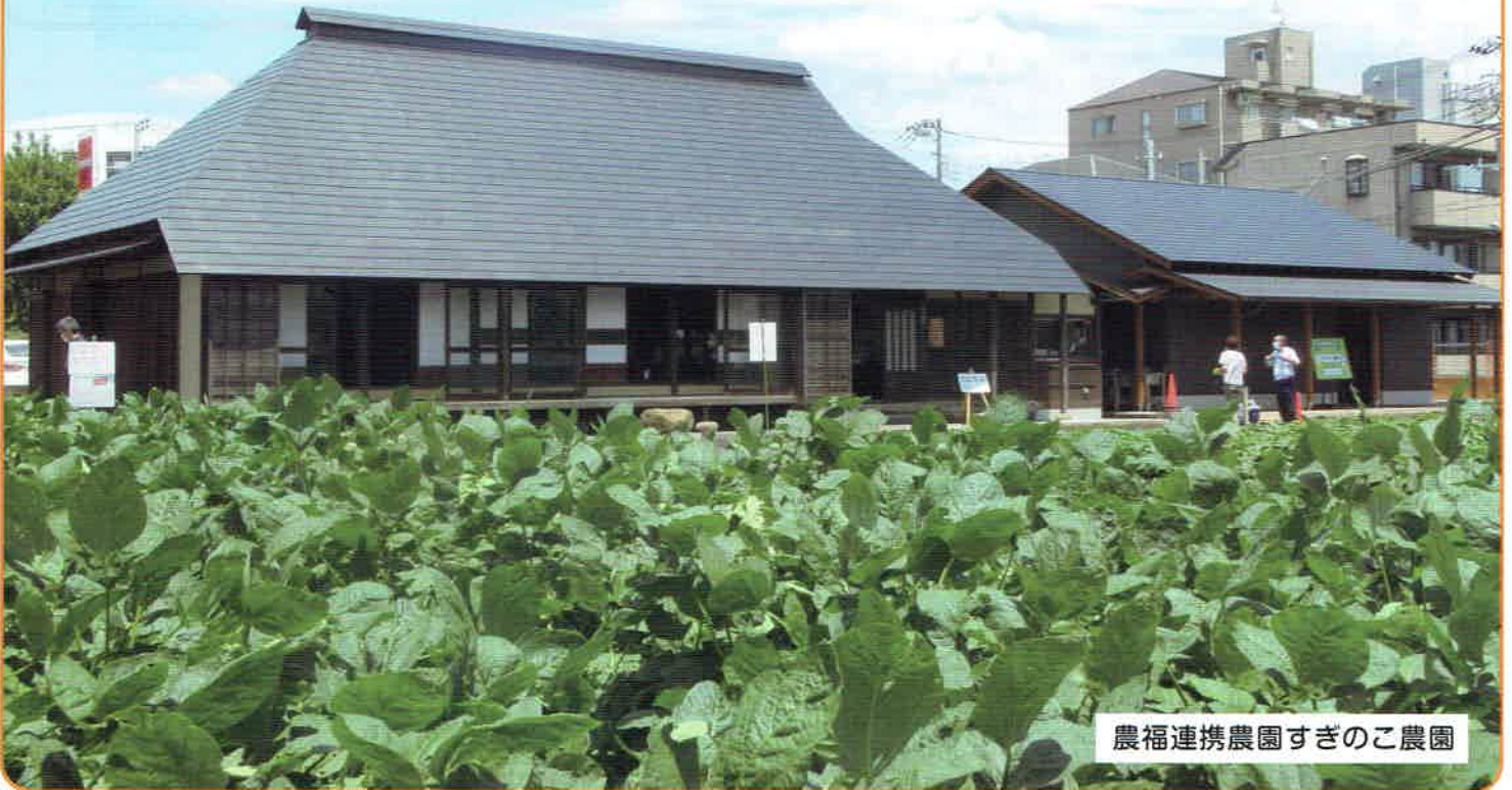
農福連携農園すぎのご農園

ごみ減量対策課では、10月3日(月)から8日(土)まで、農福連携農園(愛称:すぎのご農園)にて、「食品ロス削減に関するパネル展示」を行います。かつての杉並における農の風景を見ながら「食品ロス」について考えてみませんか?