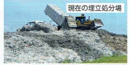
現在の埋立処分場