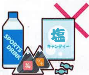
運動会やスポーツ大会への 飲食物の差し入れ