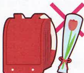
入学祝い・卒業祝い