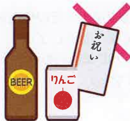
町会の集会や旅行等の 催し物への寄附や 飲食物の差し入れ