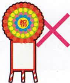
落成式・開店祝いの花輪