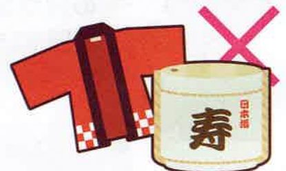
お祭りへの寄附や差し入れ