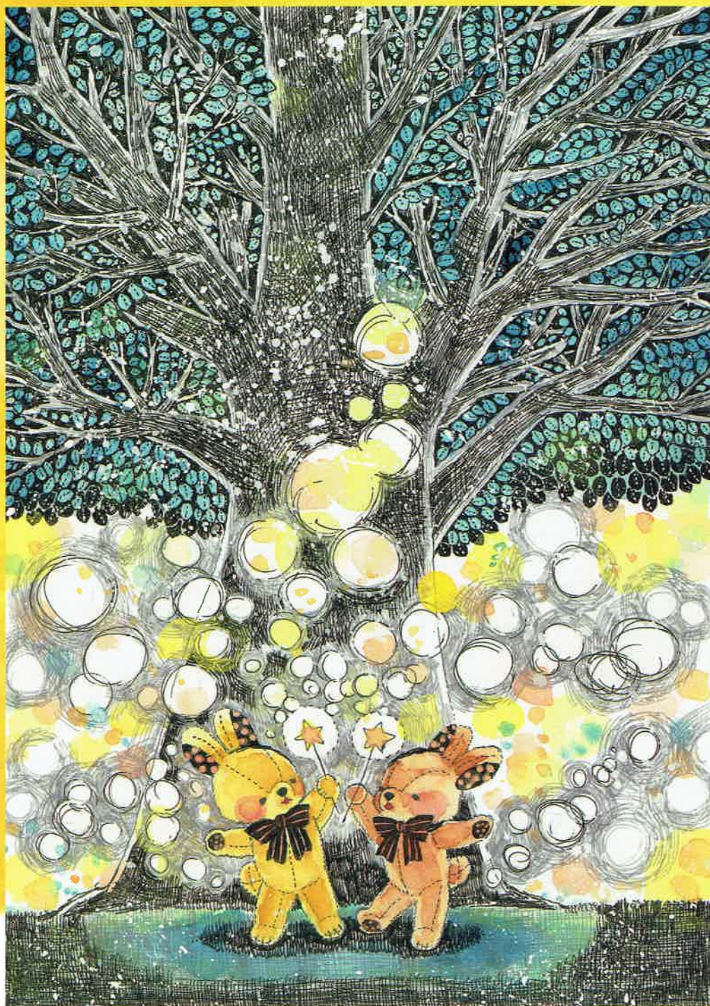
「ずっとつづくことを願っているよ。」ココロハナノ Artbility ※この作品は障害者アーティストによる作品です

お寄せいただいた募金はこの地域の福祉活動に使われます。詳細は赤い羽根データベース「ほねっと」をご覧ください。