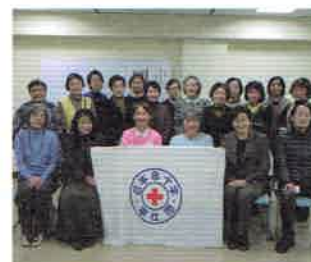
▲奉仕団研修会(座学)