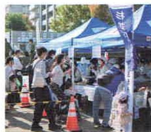
▲杉並区総合震災訓練