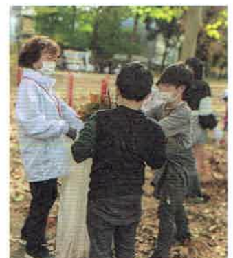
▲杉並第二小との清掃活動