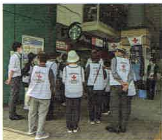
▲駅頭キャンペーン