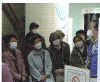
▲奉仕団研修会(視察)