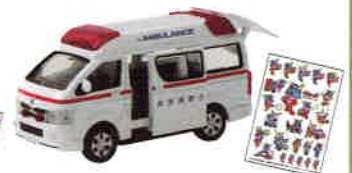
[C]ダイヤベット緊急自動車 救急車ミニカー (120mm×210mm) 1名