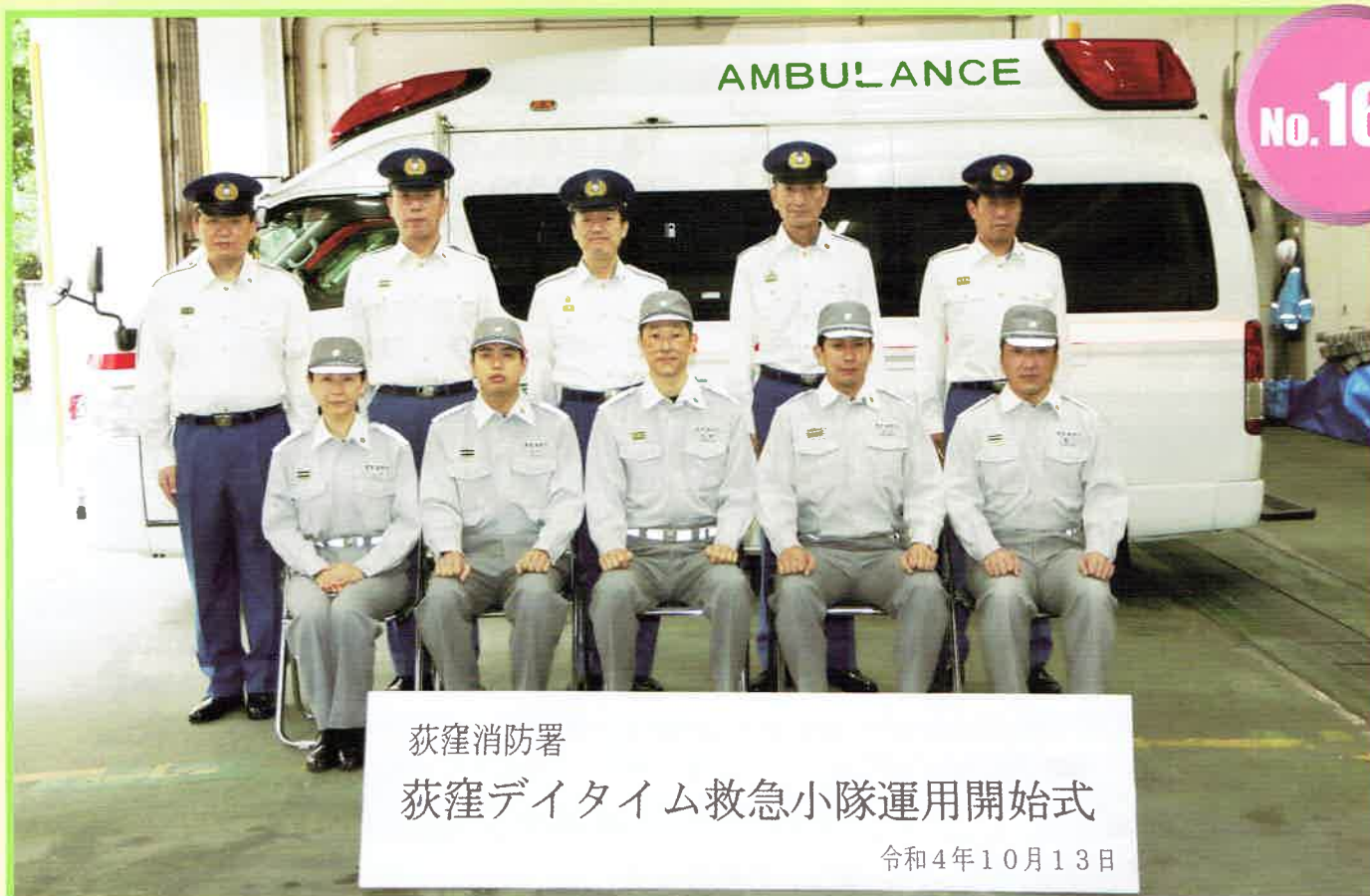
荻窪消防署 荻窪デイトタイム救急小隊運用開始式