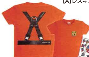
[B]消防隊なりきりキッズTシャツ (120cmサイズ) 1名