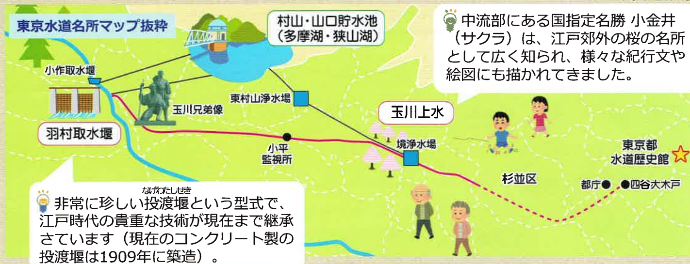
▼羽村取水堰 (羽村市)