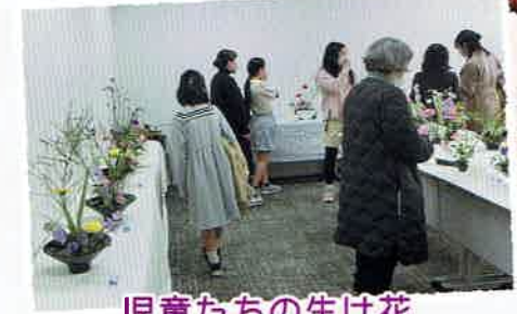
児童たちの生け花