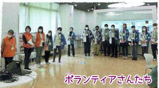
ボランティアさんたち