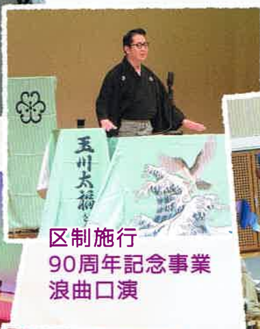
区制施行 90周年記念事業 浪曲口演