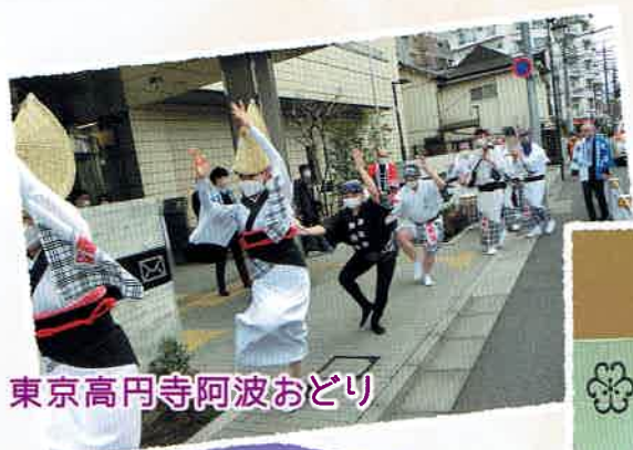
東京高円寺阿波おどり