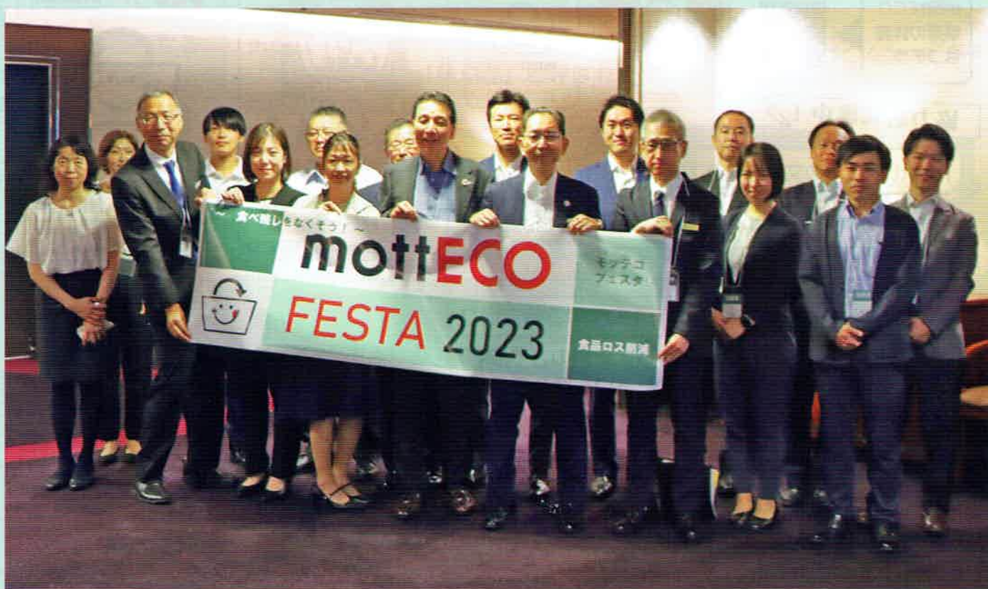
mottECO FESTA 2023 コンソーシアムメンバー