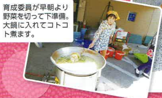
育成委員が早朝より野菜を切って下準備。大鍋に入れてコトコト煮ます。