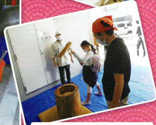
同時開催 桃二小 おやじの会のもちつき大会