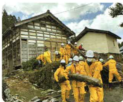
金沢工業大学の学生たちもボランティアとして応援してくれています。(穴水町)

共同募金会では、災害発生後、即座に災害支援を行えるように皆様からのご寄付金の一部を、災害等準備金として積立しています。この準備金は、被災県に設置の災害ボランティアセンターやボランティア団体の活動支援などに活用する共同募金独自の、災害時におけるたすけあいのしくみです。