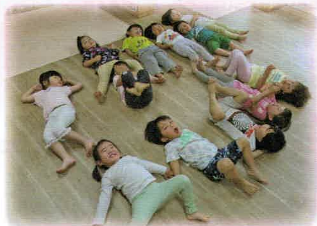
(N)KOTOともそだちネット 陽だまり保育園「こどもたちの保育室を整備しました。」

赤い羽根共同募金は子ども・家庭、高齢者、障がい者、まちづくりの推進など皆様に関わりのあるところで役立てられております。