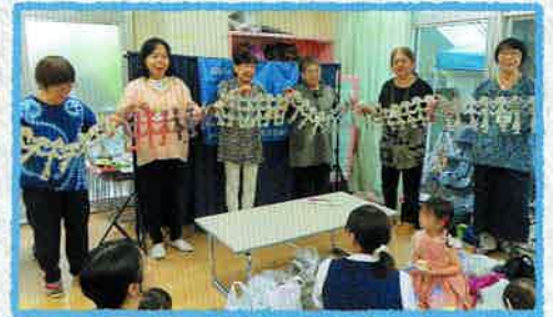
新聞紙で手をつなごう