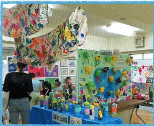
保育園の作品展示