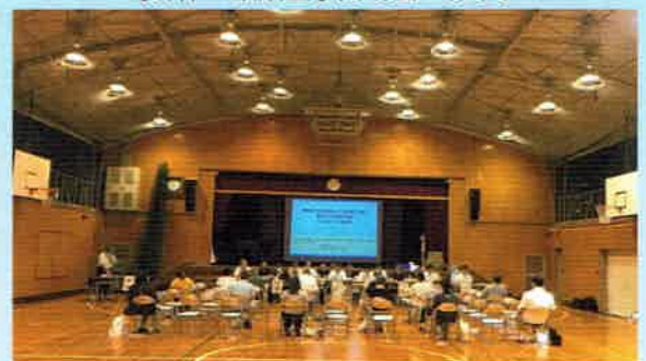
【解体・改築工事説明会の様子】