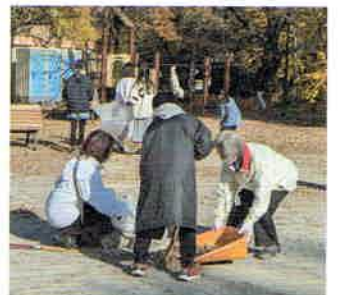
▲杉二小との清掃活動