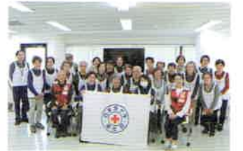
▲奉仕団研修会(座学)