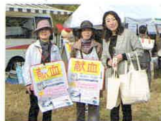
▲すぎなみフェスタ(杉並区長と)