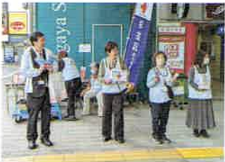
▲駅頭キャンペーン