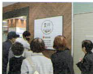
▲奉仕団研修会(視察)